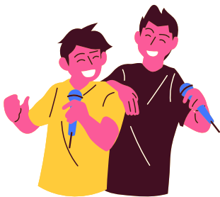
anh trai/ 14/ cao