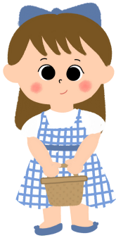
chị gái/ 6/ xinh