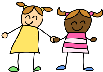
em gái/ 4/ sạch sẽ